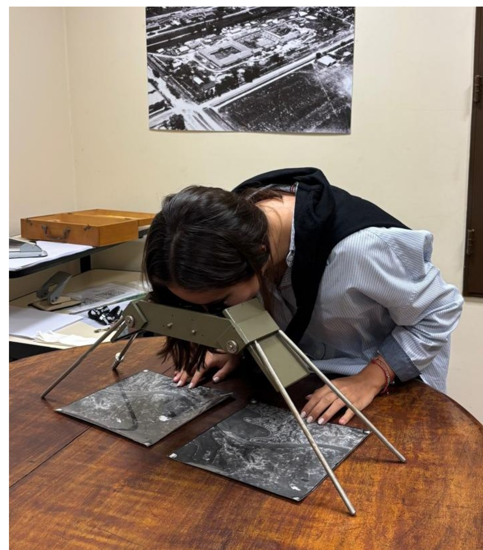
Estereoscopio de Espejos – Estereoscopio de Bolsillo.