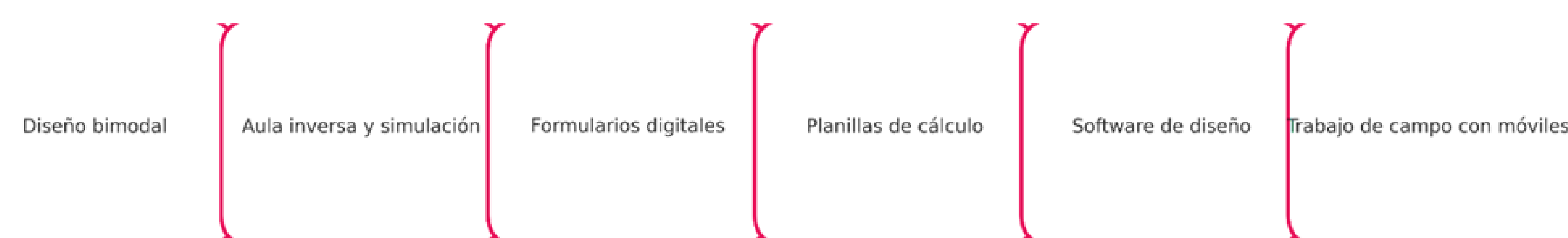
Figura 1. Estrategia metodológica con TIC en la formación en gestión (Elaboración propia mediante IA)

Se basa en el constructivismo social (Vygotsky, 1979) y el aprendizaje situado (Lave & Wenger, 1991), que conciben el conocimiento como construcción colaborativa mediada por tecnologías y anclada en la experiencia contextualizada.