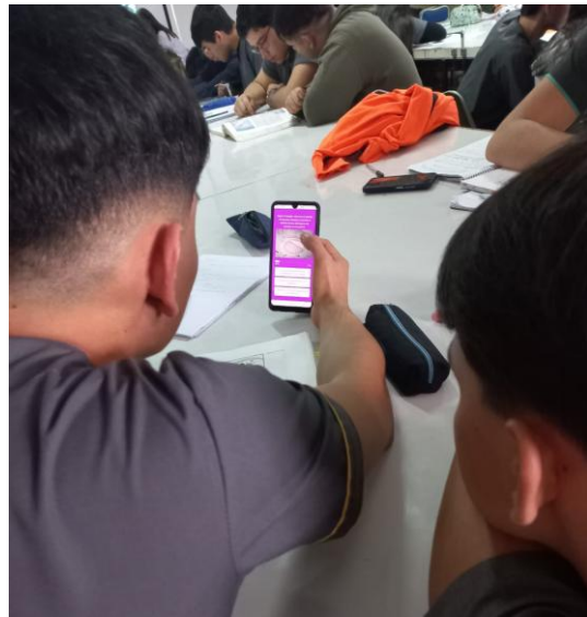
C. Actividad de reconocimiento e identificación de preparados utilizando dispositivo móvil e imágenes digitalizadas Histología FOUNNE.

En el marco de las experiencias docentes que incorporan observación microscópica, se ha trabajado con una variedad de preparados histológicos obtenidos de fotografías a partir de muestras físicas. Sin embargo, se presentaron ciertas limitaciones técnicas