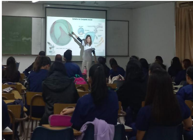
A. Observación microscópica de germen dentario con proyección de imagen en video data 9

La microscopía virtual representa una innovación pedagógica que responde eficazmente a las demandas de la educación superior contemporánea. Su implementación aporta beneficios claros, tanto en términos didácticos como operativos, mejora la accesibilidad,